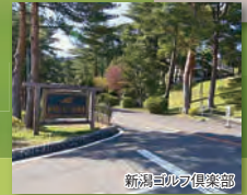
新潟ゴルフ倶楽部